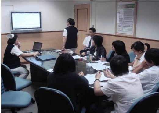
內容專家簡報訓練需求-1