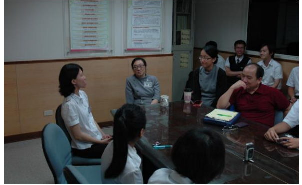
內容專家簡報訓練需求-2