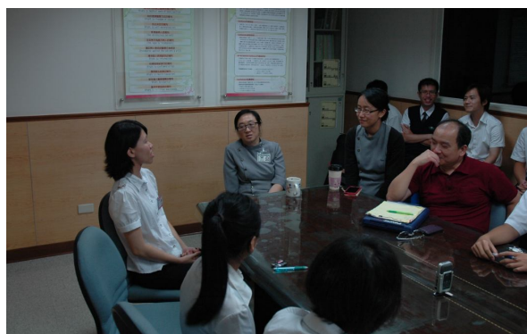
內容專家簡報訓練需求-2